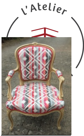
MODULE SIEGE LOUIS XV