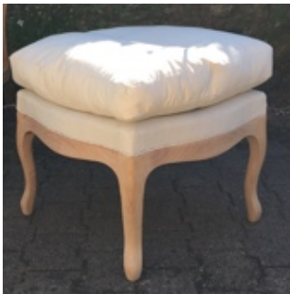
MODULE GARNITURE EN CUVETTE AVEC COUSSIN A PLATE BANDE PASSEPOILE.

Alternance de cours théoriques et de cours pratiques.