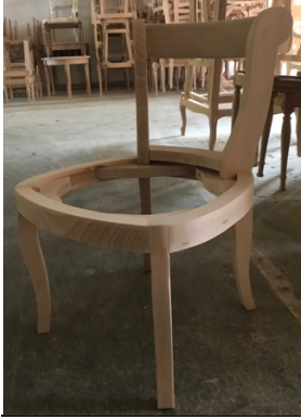
MODULE GARNITURE PIQUEE COIFFEUSE NAPOLEON OU LOUIS XV