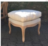
MODULE GARNITURE EN CUVETTE AVEC COUSSIN A PLATE BANDE PASSEPOILE.