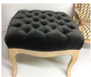
MODULE GARNITURE CAPITONNEE EN MOUSSE 5 jours(40 H)-