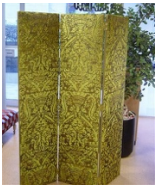
MODULE PARAVENT 3 PANS