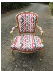
MODULE DOSSIER SIEGE LOUIS XV