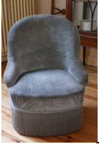
MODULE FAUTEUIL TYPE CRAPAUD. Dossier à bosse