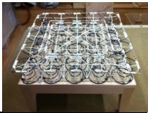
MODULE GARNITURE SUSPENDU