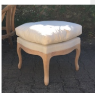
MODULE GARNITURE EN CUVETTE AVEC COUSSIN A PLATE BANDE PASSEPOILE.