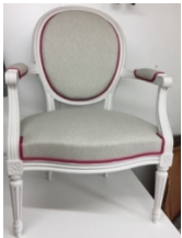
MODULE GARNITURE DU CABRIOLET LOUIS XVI MEDAILLON