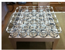
MODULE GARNITURE SUSPENDU