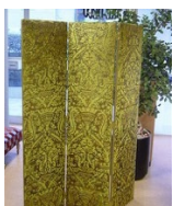
MODULE PARAVENT 3 PANS

Ce module est très apprécié des élèves car ce siège présente des techniques importantes et est très prisé des clients.