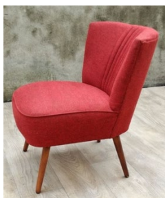
MODULE SIEGE 'COCKTAIL'.