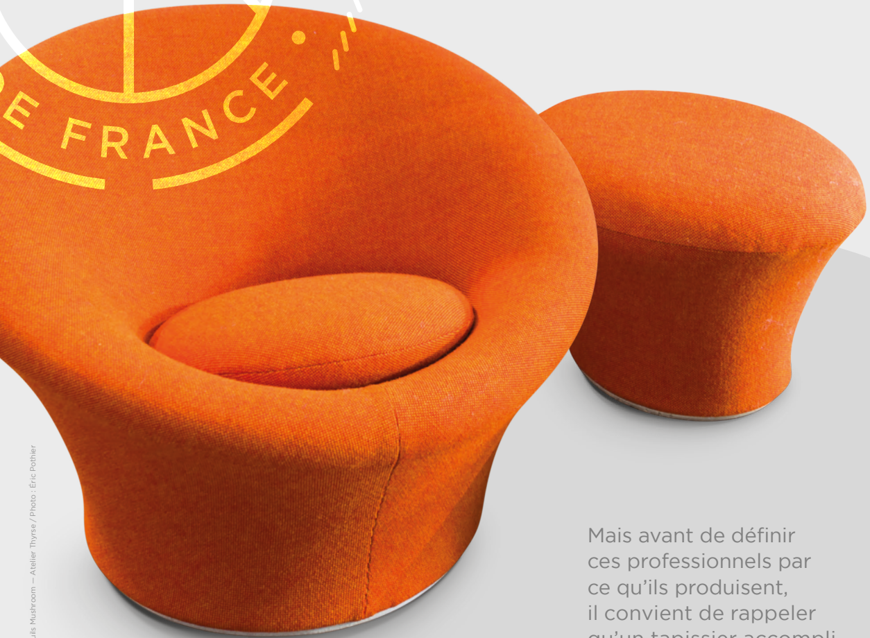
Fauteuils Mustroom - Atelier Thyse

C'est avant tout le cumul d'une grande polyvalence et une maîtrise de nombreuses compétences.